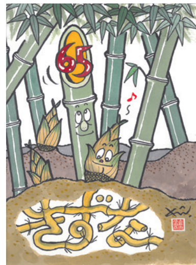
京都西ロータリークラブ65周年記念 遊墨漫画家 南久美子氏作「きすな」

真実かどうか みんなに公平か 好意と友情 深めるか みんなの為に なるかどうか こころがけよう 四つのテスト