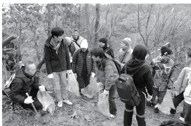
12/7 京都一周トレイル西山コース体験&清掃事業