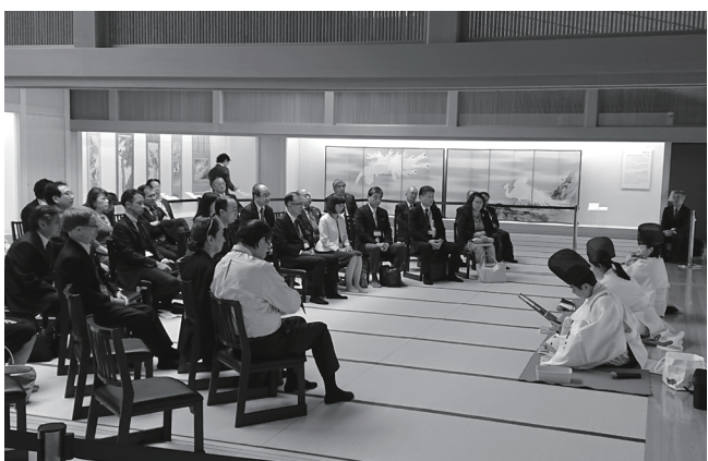
9/30 東京西RCとの交流会