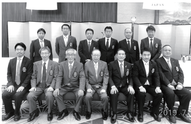
7/1 理事・役員 集合写真