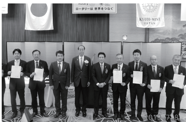
7/8 佐竹力總ガバナー公式訪問