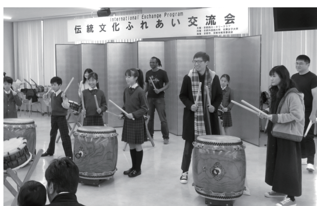
1/26 伝統文化ふれあい交流会