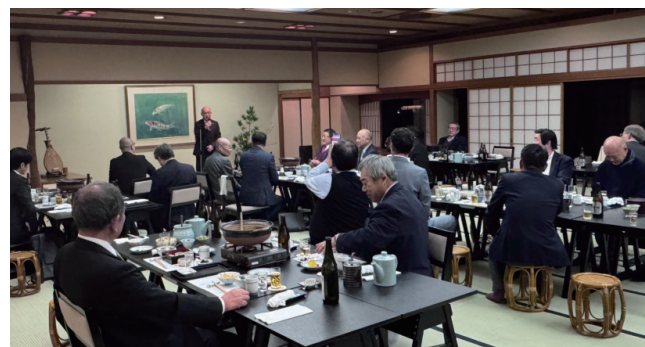
2月2日 第100回記念 旬をたべる会