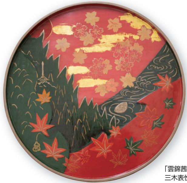
「雲錦茜空 飾盆」 三木表悦 会員作

国際ロータリー 第2650地区スローガン “ロータリーの原点に戻る” 誠意をもって語り合い、勇気をもって共に未来へ RI第2650地区ガバナー 松原六郎